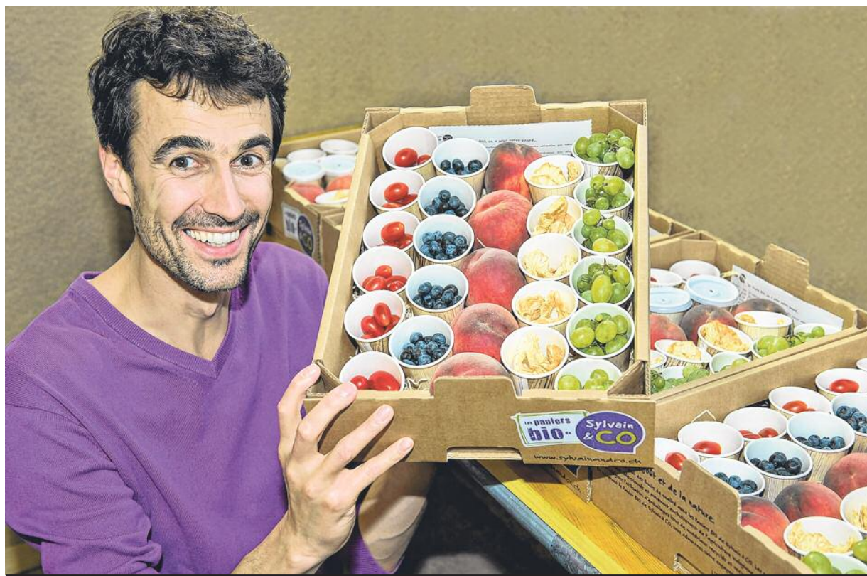
Sylvain & Co offre des produits en conditionnements pratiques.

9 Sylvain & Co vous veut du bien. Cette entreprise maraîchère basée à Essert-sous-Champvent (VD) est active dans la quatrième gamme. Elle offre toute un assortiment de fruits et légumes conditionnés en sachets, box, barquettes ou paniers, dont une partie est produite selon les principes de l'agriculture biodynamique. Son objectif: faciliter la consommation de fruits et légumes. Ses moyens: une direction novatrice, une équipe motivée et une communication ludique. Le tout dans le respect des valeurs humaines.