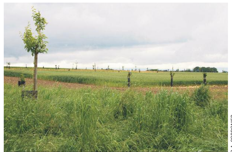
L'agroforesterie gagne des adeptes en Suisse.

4 Pour certains, le terme évoquera quelque agriculture lointaine et exotique: l'agroforesterie a été pourtant pratiquée en Europe avant que s'impose l'agriculture intensive. Cette technique est aujourd'hui remise au goût du jour. Premier volet de notre enquête sur cette pratique durable.