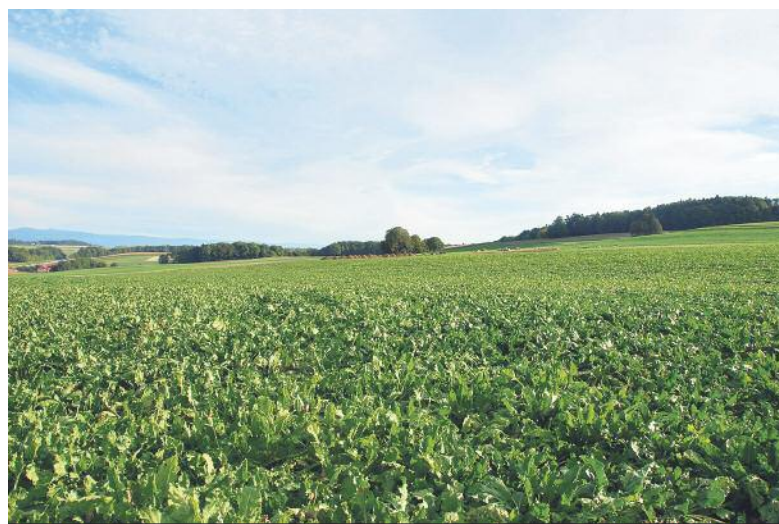
Les abus de traitements sont plus fréquents dans la betterave.

3 Diverses professions gravitent autour de l'agriculteur et lui prodiguent des conseils en tous genres. Même si ces personnes proviennent du même milieu, elles ne sont pas toujours du même avis! Cette semaine, conseillers en phytosanitaires et vendeurs de produits se confrontent.